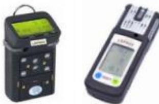
Détecteurs de gaz