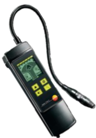
Recherche de fuites