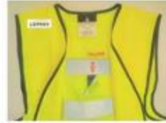
Gilet alarme postures inadaptées