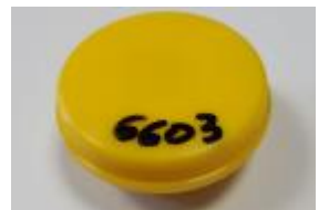
Mousse + coupelle CIP10