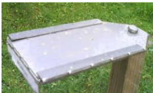
Plaquette de Dépôts de poussières