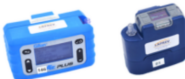
Pompes de prélèvement