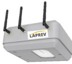
Station connectée sans fil (gaz, poussières, température, hygrométrie, bruit)