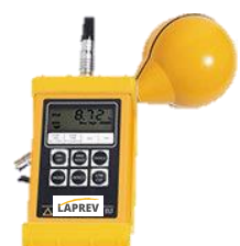
Mesureur de Champs magnétiques