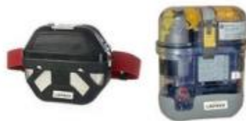
Auto sauveurs isolants