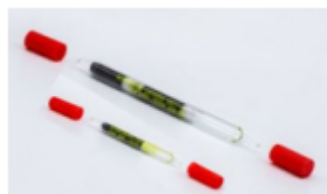
Tubes de prélèvement