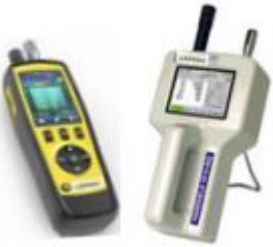
Compteurs de particules