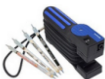
Pompe pour tubes réactifs