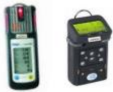
DéTECTEURS de gaz