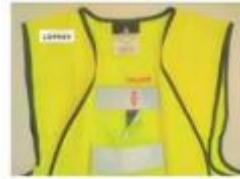
Gilet alarme postures inadaptées