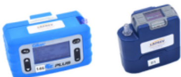
Pompes de prélèvement