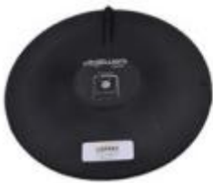
Vibrations corps entier