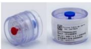
Cassettes de prélèvement