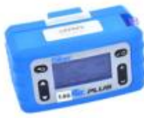
Pompe de prélèvement