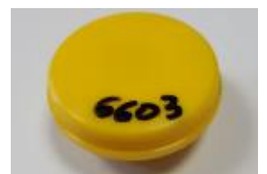
Mousse + coupelle CIP10