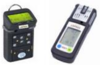
Détecteurs de gaz