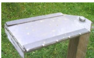
Plaquette de Dépôts de poussières